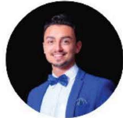
کوشا گودرزی گوینده و مجری حرفه ای