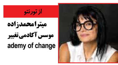
از تورنتو میترا محمدزاده موسی آکادمی تغییر ademy of change

خوانندگان گرامی می توانند برای حمایت از نامبر دگان به وبسایت زیر مراجعه کنند. canadianimmigrant.ca