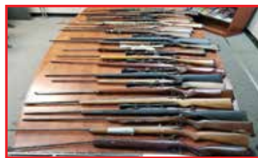
قرار داده و موفق به کشف این سلاحها شدند.

دومر دینز در Sandy Bay در هنگام کشف این سلاحها دستگیر شدند. طی روزهای آینده افراد دستگیر شده برای دفاع از خود باید در دادگاه حاضر شوند.