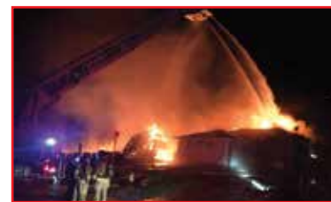
آتش سوزی چندین خانه در Barrie

منجر به خساراتی بالغ بر ۲ میلیون دلار بر مالکان این خانه ها شد.