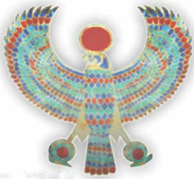
درفش به جا مانده از کوروش بزرگ

در زمان کیکاووس پیری و مرگ از بین می رود و مردم به محض آب تنی در نهرهای کاخ او جوانی و سلامتی مجدد پیدا می کردند... بر طبق اسطوره های ایرانی خداوند برای پادشاه رفتارهای نیک کیکاووس او را جاویدان می کند اما کیکاووس به خودش مغرور می شود و برای روبه رو شدن با خدا و ادعای خدایی به آسمان می رود. او تختی میباید که عقابهایی بدان می بندد تا او را به آسمان ببرند... کاری به باقی ماجرا نداریم که چه اتفاقی می افتد و چطور کی کاووس به دلیل اشتباهی که کرده جاودانگی اش را از دست می دهد انسانی میرا می شود.