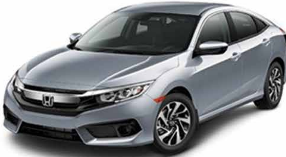
CIVIC SE MODEL SHOWN

OR STEP-UP TO THE NEW 2018 CIVIC SE FOR $8 MORE WEEKLY*